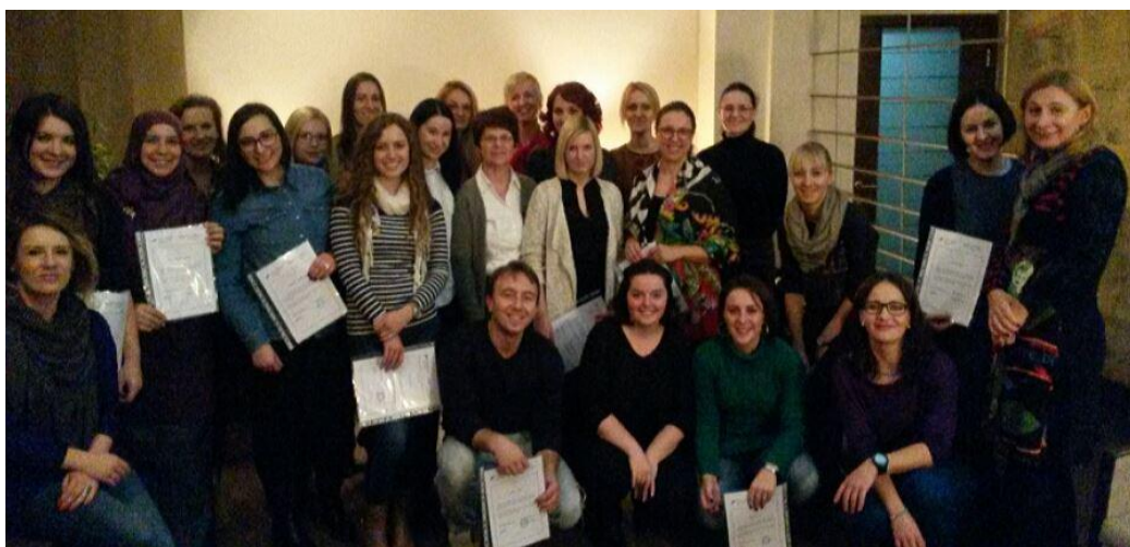
Treća generacija polaznika

Svi primjeri predstavljeni na superviziji moraju biti predani i u pismenom obliku koji treba sadržavati: konceptualizaciju primjera, pitanje za superviziju te daljnje smjernice i preporuke. Jedan od prikaza treba uključivati rad sa “teškim” klijentom u bilo kojoj fazi tretmana (npr. nesuradljiv klijent, višestruki komorbiditet, ozbiljna psihopatologija, specifičnosti klijenta i sl.). Od polaznika se tokom ovog stepena edukacije zahtijeva prezentiranje barem 10 završenih prikaza slučaja.